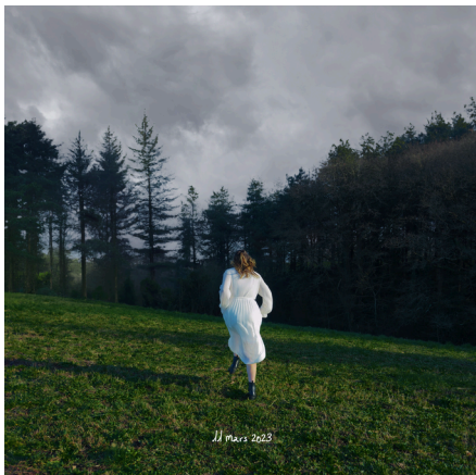
Pochette du single 11 Mars 2023 par Marie Guignard